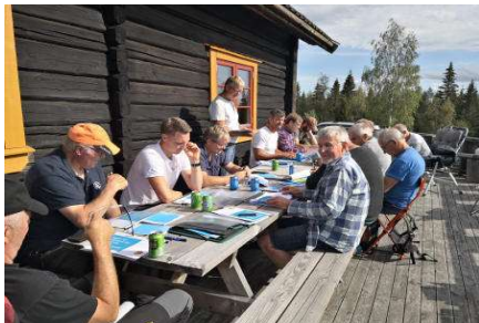
Oppdatering av jaktprøveregler

Det var oppdatering i nye jaktprøveregler, los og gode diskusjoner, mat, drikke og topp stemning.