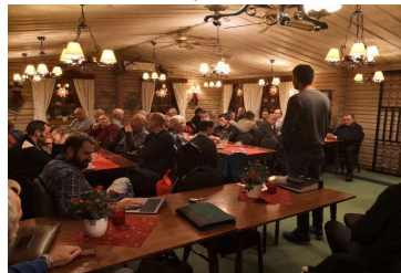
Julemiddag på Furulund

Det har i beretningsåret vært avholdt 1 årsmøte, 4 styremøter, 1 medlemsmøte med premieutdeling, 1 medlemsmøte med julemiddag og diverse komitemøter.