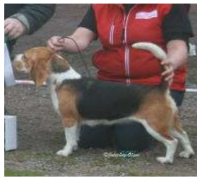
JO My Own Treasure Huntress